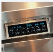
Вращающаяся панель управления

Данное оборудование сертифицировано Star-K в строгом соответствии с религиозными правилами, согласно специальным инструкциям, которые можно найти на сайте www.star-k.org .