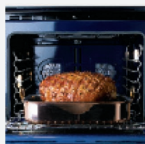
Внутренняя отделка камеры цвета синий кобальт.