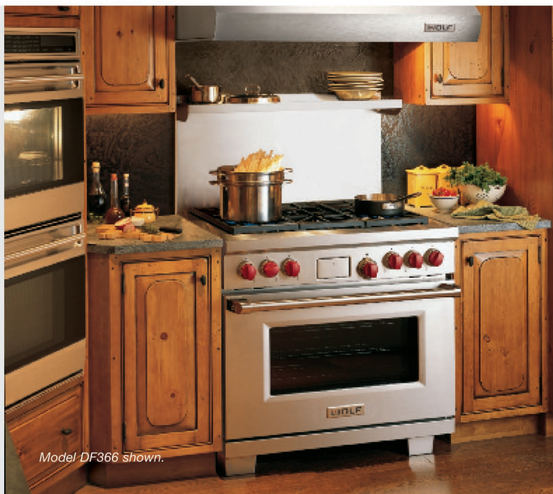
Model DF366 shown.

Плиты Wolf, работающие на двух видах топлива, разработаны по последнему слову техники с учетом всех пожеланий потребителей. Эти плиты оборудованы стандартными герметичными газовыми конфорками с двумя контурами пламени. Большие электрические духовые шкафы имеют десять режимов приготовления пищи и совершенную систему двойной конвекции Wolf, обеспечивая равномерное распределение температуры и тепла. Функционируют на природном газе и газе пропане.