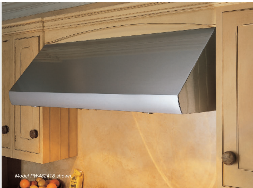
Model PW482418 shown.

Настенные вытяжки Wolf Pro глубиной 686 мм помимо функций термодатчика и двухрежимного галогенового освещения обладают еще одной исключительной функцией - термолампами. Вытяжки Pro глубиной 610 мм поставляются в семи размерах.