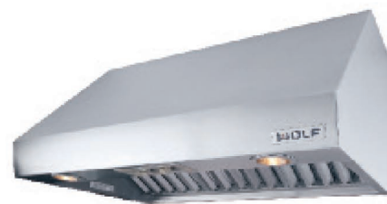
Модель PW482418 настенной вытяжки Pro