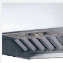
Скрытая панель управления