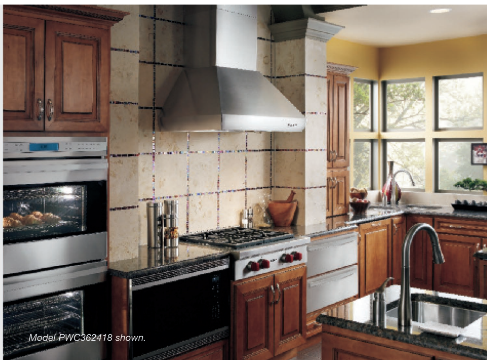
Model PWC362418 shown.

Настенные вытяжки Wolf Pro дымоходного типа с такими функциями как наличие термодатчика и двухрежимного галогенового освещения, представляют собой совершенство в вентиляции. Вытяжки Pro дымоходного типа поставляются в четырех размерах. Они могут устанавливаться с опциональной панелью из нержавеющей стали, закрывающую вентиляционную трубу, размером 152 мм, 305 мм, 457 мм или 610 мм, что формирует целостный дизайн данной модели вытяжки.