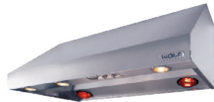
Модель PW602718 настенной вытяжки Pro

Вы можете заказать данные аксессуары у официального дилера Wolf. Для получения информации о дилере посетите наш веб-сайт wolfappliance.com .