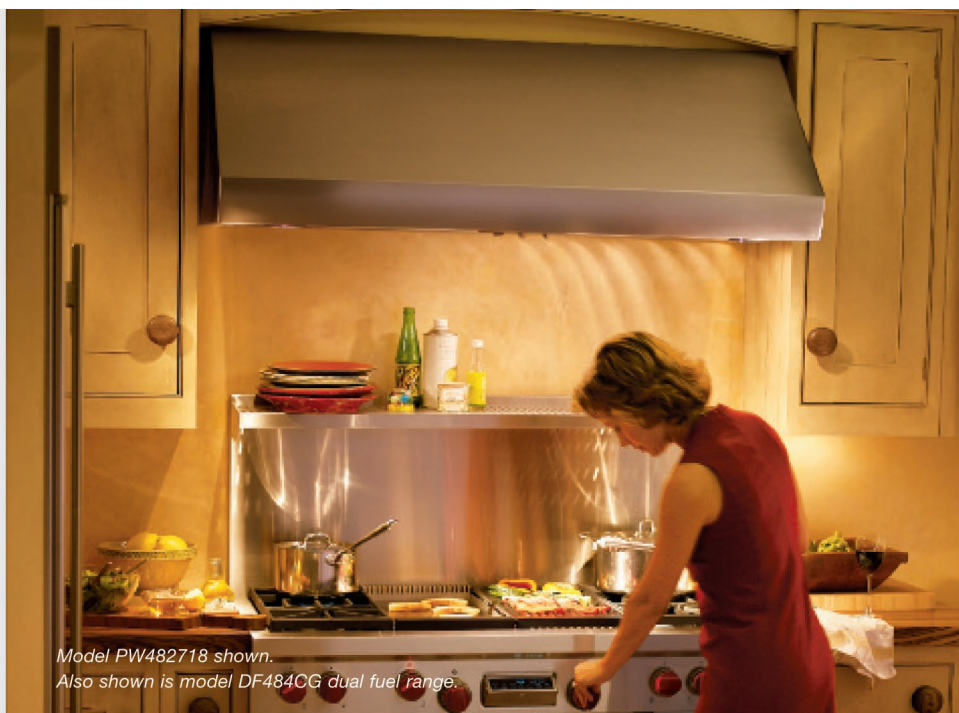
Model PW482718 shown. Also shown is model DF484CG dual fuel range.

Настенные вытяжки Wolf Pro глубиной 686 мм помимо функций термодатчика и двухрежимного галогенового освещения обладают еще одной исключительной функцией - термолампами. Вытяжки Pro глубиной 686 мм поставляются в семи размерах.